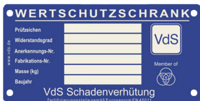
Beispiel Typenschild VdS-Tresore

Sehr geehrter Kunde, bitte bewahren Sie dieses PDF sorgfältig auf. Serienmäßig erhalten Sie mit Ihrem Tresor zwei Doppelschlüssel. Für Ersatz- oder Nachbestellungen verwenden Sie bitte dieses Formular. Bei Tresormodellen mit den hier abgebildeten Typenschildern können aus Sicherheitsgründen Ersatzschlüssel nur nach Vorlage eines Originalschlüssels angefertigt werden. Diese Vorschriften wurden zu Ihrer Sicherheit vom Verband der Schadenversicherer VdS in Köln herausgegeben.